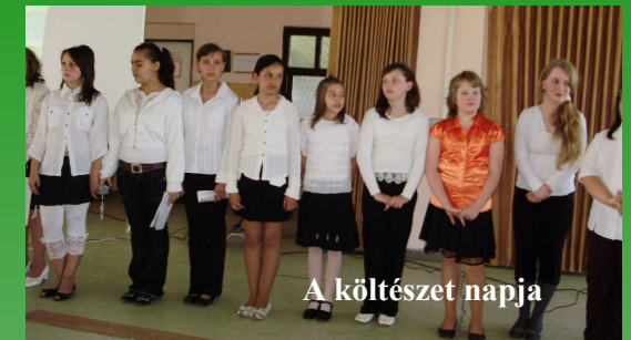
A költészet napja