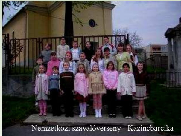
Nemzetközi szavalóverseny - Kazincbarcika

A fentiek megvalósítása érdekében olyan hatékony minőségbiztosítási